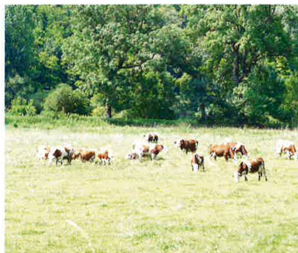
Prairies humides et pâturées, localisées en bordure du chemin de halage