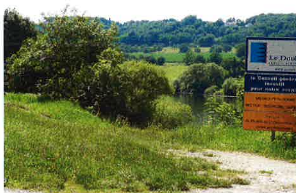
La ripisylve bordant la véloroute doit être entretenue et replantée