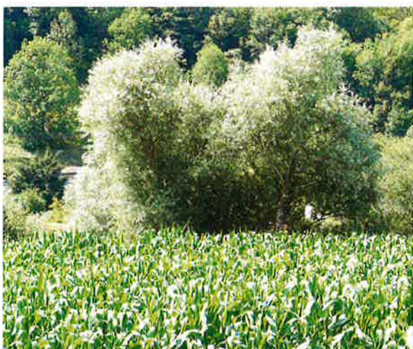
Les saules blancs de la ripisylve émergent derrière les champs de maïs

Cette zone est traversée par la véloroute Nantes Budapest qui emprunte l'ancien chemin de halage.