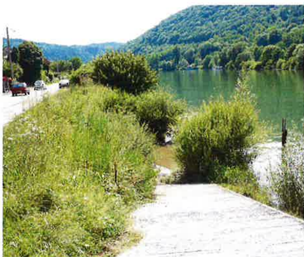
L'aménagement des accès au Doubs constitue un point d'attractivité important

La construction dans ce secteur n'est pas envisagée.